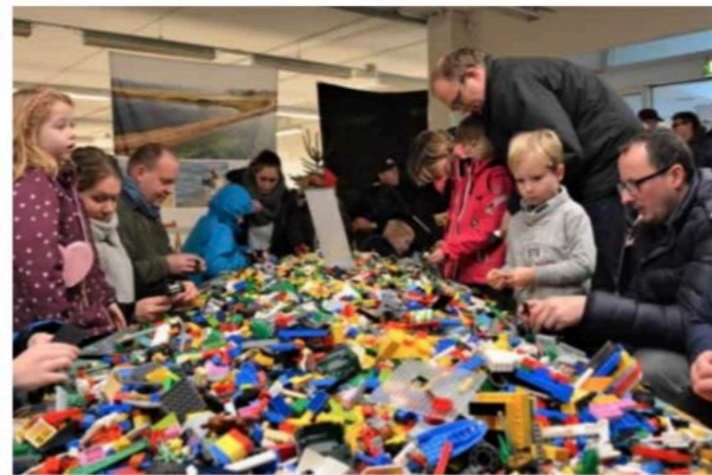
Det var ikke LEGO, der manglede.