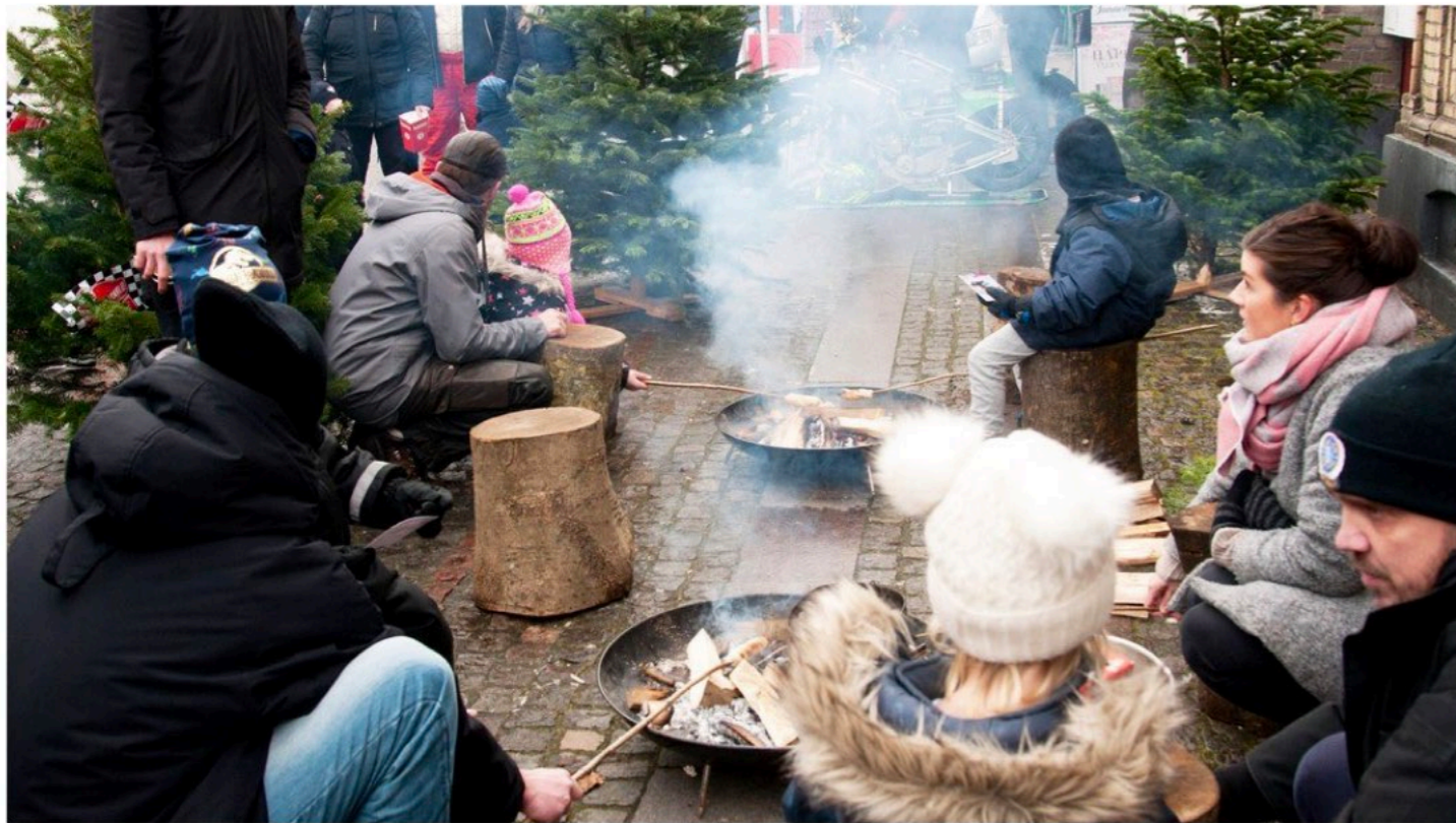
Spejderne fra Verringegruppen tænder op for bålene ved PRE-starten i Assens den 21. januar