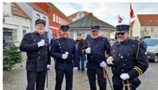
Assens Borgerlige Skyttelaug sørgede for god ro og orden i byen.