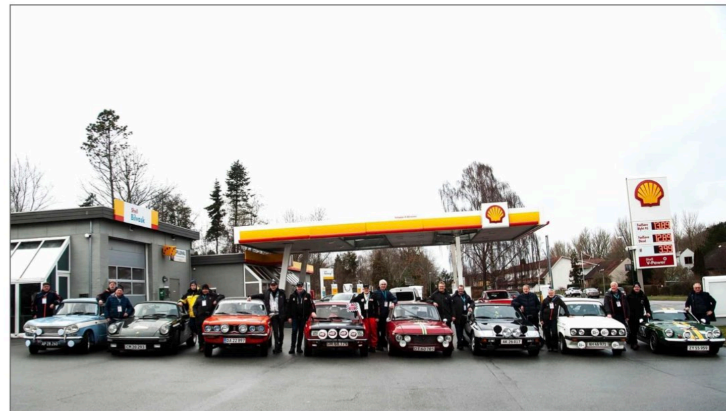
De otte biler, der deltog i pre-starten i Assens, er her linet op hos Shell i Assens.