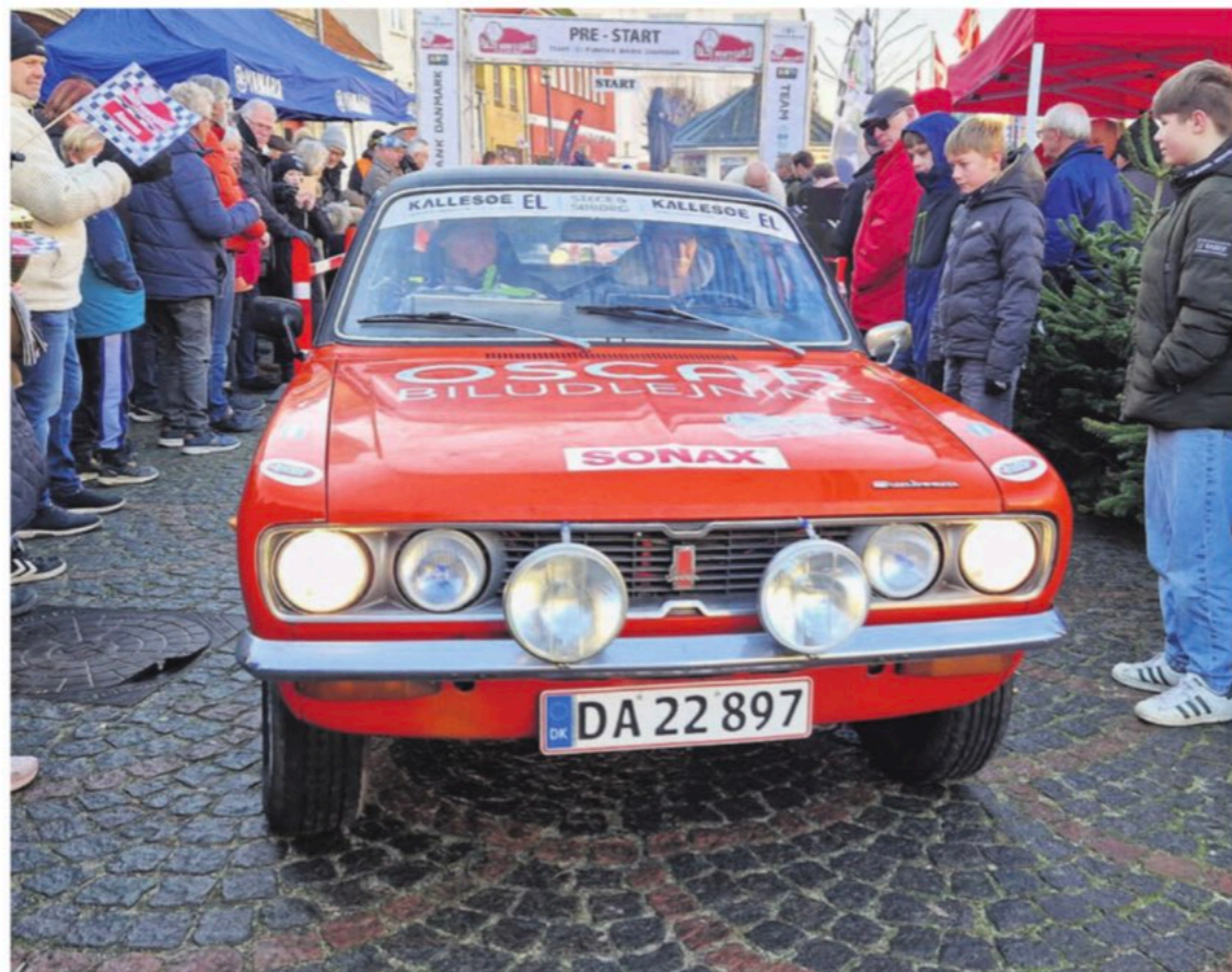
På lørdag er der igen pre-start i Assens på billobet Rallye Monte Carlo Historique.

Publikum kan glæde sig til at opleve historiske køretøjer; fra oldtimers til robuste rallybiler. Det er ikke kun en fejring af de danske rally-