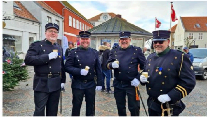
Assens Borgerlige Skyttelaug sørgede for god ro og orden i byen.

Fra en venlig og begejstret tilskuer til Lars Hindsgaul