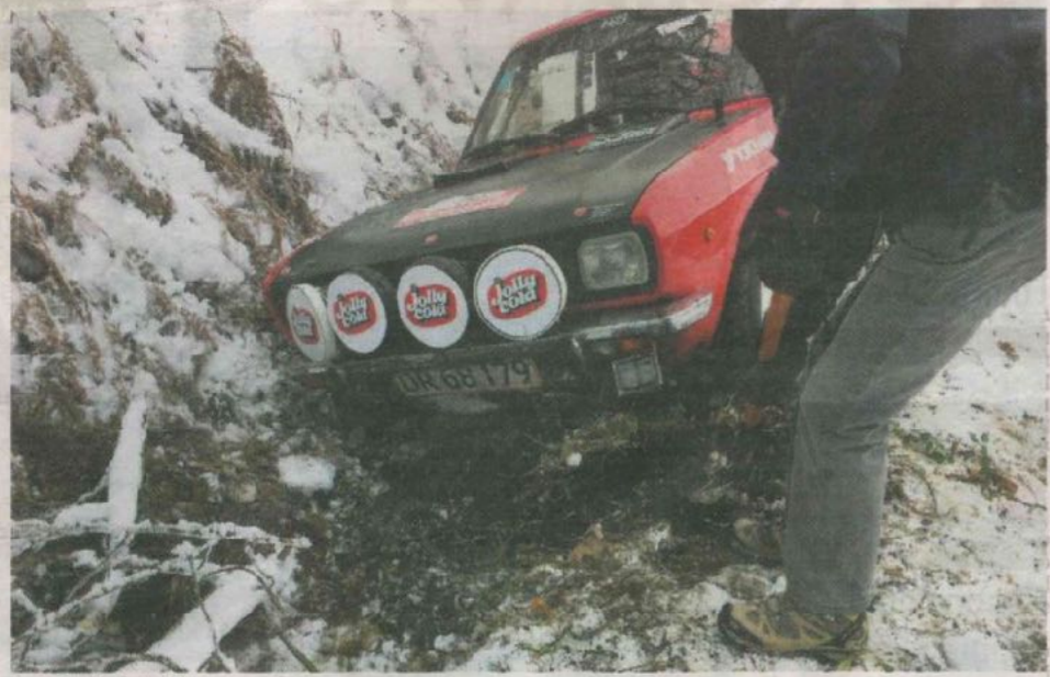
Team Fynske Banks Fiat 500 Coupé måtte trække sig fra rallyløbet i Frankrig lidt tidligere end planlagt.

leder udendørstræningen i den første uge i april, hvor alle interesserede er velkomne til at møde op og træne med. Information om træ-