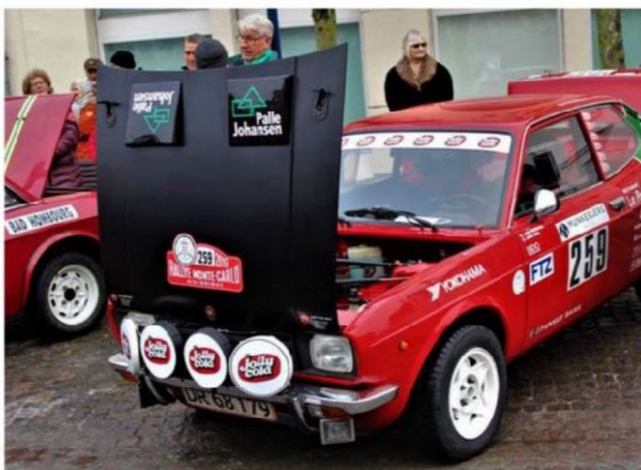
Om formiddagen kunne interesserede kigge nærmere på bilerne, inden de kører sydpå til årets Rally Monte Carlo Historique.

I år deltager 7 danske hold ved Rally Monte Carlo.