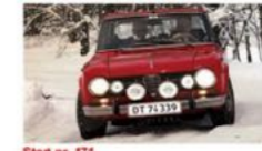
Start nr. 171 Poul Møllers / Carl Høllmers Alfa Romeo, Giulia Super, årgang 1970