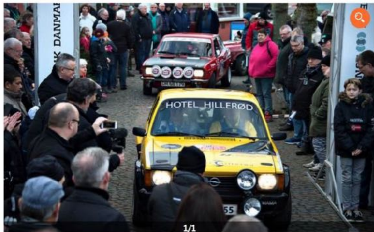
Lørdag 26. januar kan man som sidste år møde alle de deltagende danske rally-biler i Assens.

AF: EXPRESS EXPRESS7@JFMEDIER.DK Publiceret 16. januar 2019 kl. 19:08