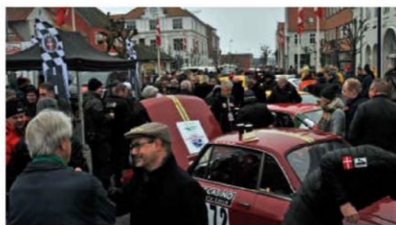
Der var en god stemning på torvet i Assens til Pre-starten på Rally Monte Carlo Historique. Mange kiggede forbi for at ønske god tur.

Der er store forventninger til de danske kører fra Team Fynske Bank Danmark, da flere af deltagerne fra teamet tidligere har gjort sig gældende i toppen af feltet, når resultatet efter fem dages hårde udfordringer er gjort op. Når deltagerne kommer i mål i Monaco natten imellem den 6. og 7. februar, vil vi se årets resultater.